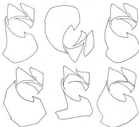
à partir d'une lettre calligraphié