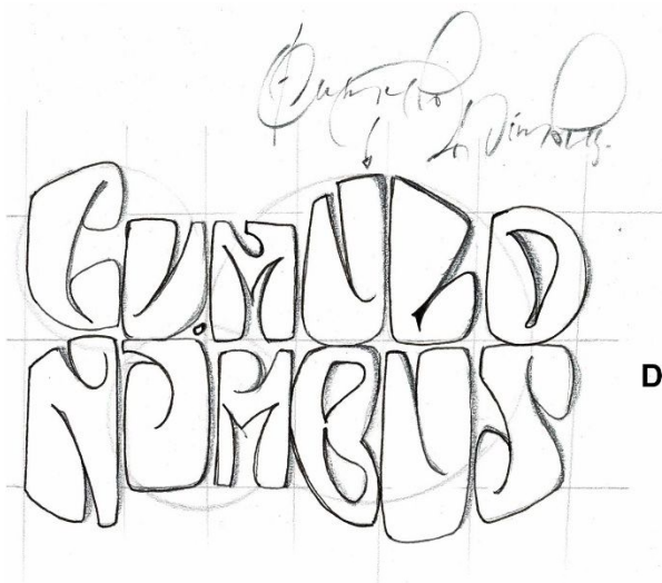
D'après Alfred Roller